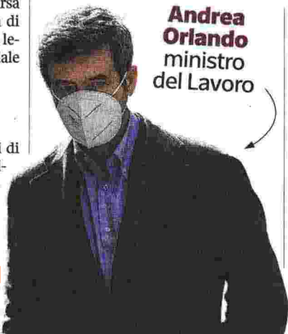
Andrea Orlando ministro del Lavoro

Un Paese civile e solidale dovrebbe occuparsi di più anche dell'umore dei propri cittadini in difficoltà e dimostrare loro che con un discreto impegno personale si può sfuggire alla disoccupazione cronica. Tutti sono una risorsa. Nessuno è uno scarto. «Il fenomeno del cosiddetto mismatch — è l'opinione di Severino Salvemini, docente alla Bocconi e presidente della Fondazione Adecco — colpisce tutte le economie avanzate, rischia di essere fortemente ampliato con la pandemia. Da un'indagine di Boston